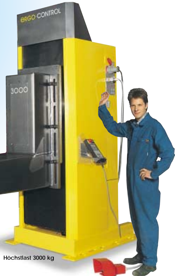
Höchstlast 3000 kg