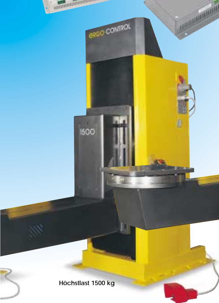
Höchstlast 1500 kg